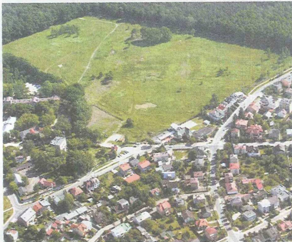
Część drzew na terenie Drewnicy już wykarczowano

publiczno-prywatnego było małe (głównie ze względu na specyfikę działalności, jaką jest opieka psychiatryczna i jej niedoszacowanie w kontraktach z płatnikiem) – ostatecznie inwestycja została umieszczona w Wieloletniej Prognozie Finansowej Województwa Mazowieckiego. Przyjęty model finansowania zakłada, że inwestycja finansowana będzie ze środków pozyskanych przez Spółkę z emisji obligacji, z jednoczesnym zobowiązaniem się Województwa Mazowieckiego do podwyższenia kapitału zakładowego tytułem wsparcia finansowego realizacji przedsięwzięcia. W sytuacji, gdy Spółka nie zgromadzi odpowiednich środków na obsługę zobowiązań z obligacji. Ostateczne kwoty